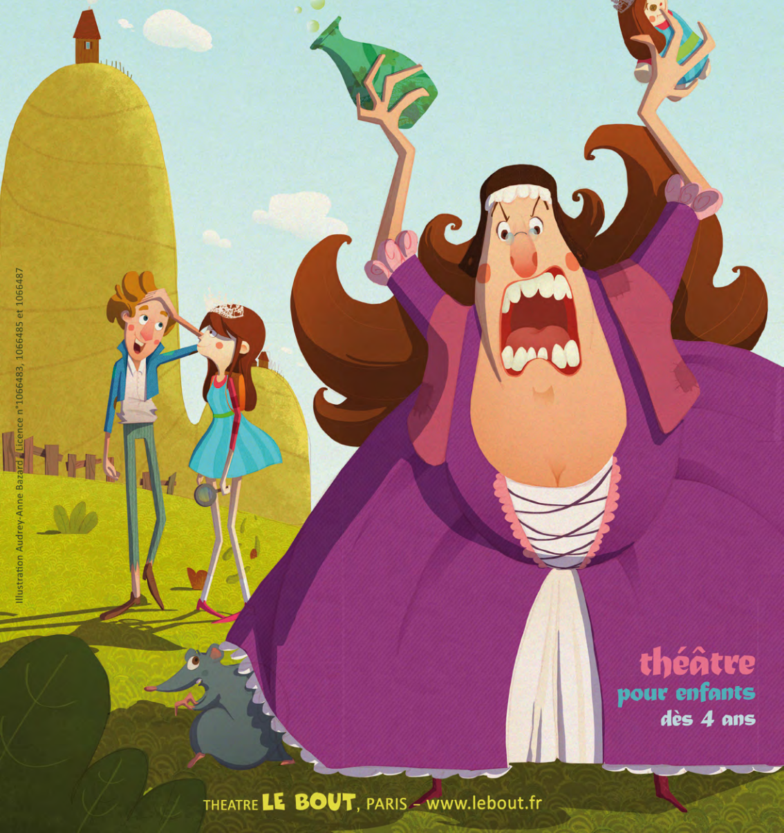
Illustration Audrey-Anne Bazard - Licence n°1066483, 1066485 et 1066487